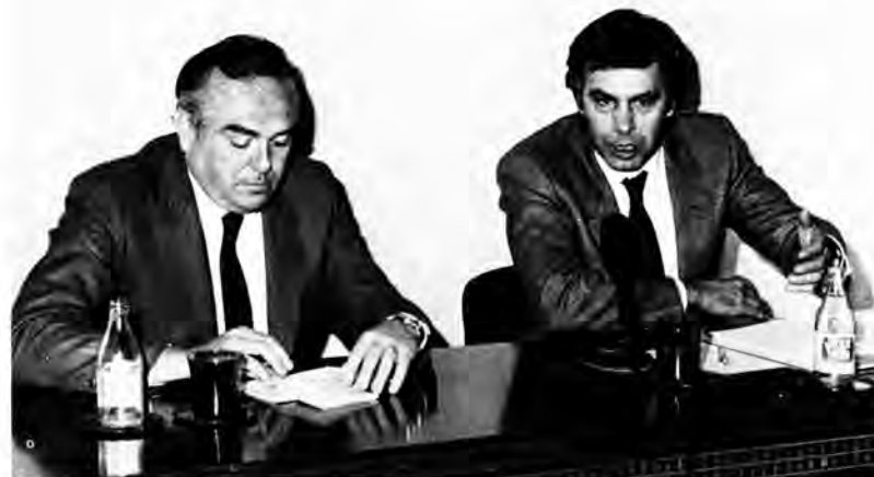
LA JUNTA DIRECTIVA EL CONTEXT TEMPORAL CONFERÈNCIES REUNIONS A PORTA TANCADA VIII REUNIÓ COSTA BRAVA CONCLUSIONS