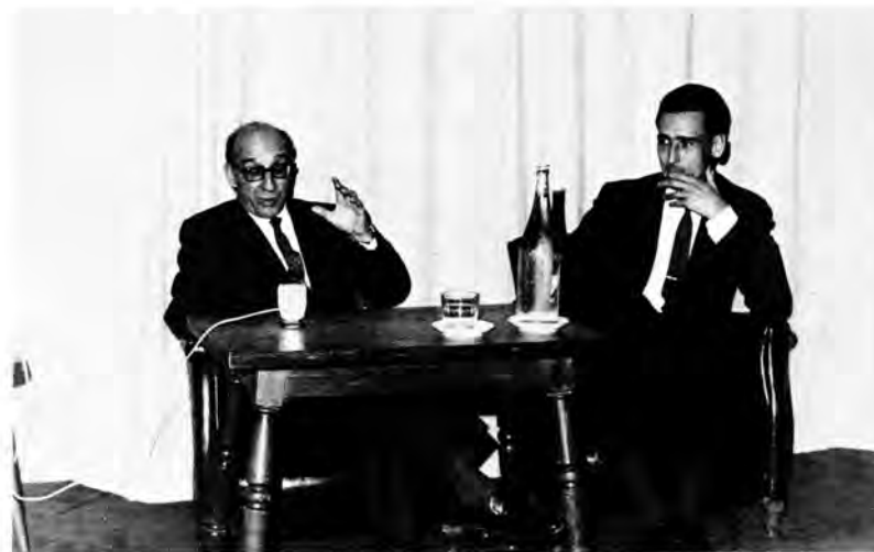
EL CERCLE I ELS ECONOMISTES EL CERCLE I L'ADMINISTRACIÓ PÚBLICA